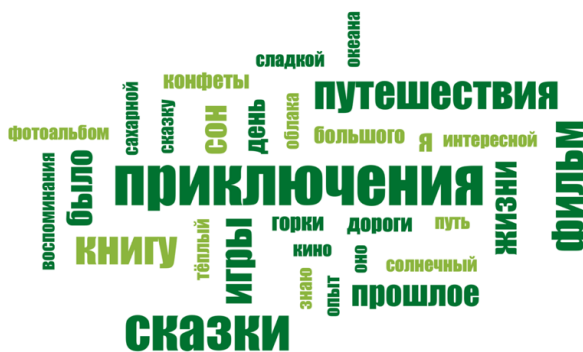
Рис. 2. Результаты контент-анализа по группе социальных репрезентаций «Прошлое» у респондентов, завершивших обучение в вузе

незаконченных предложений «Прошлое», изображены на рис. 2.