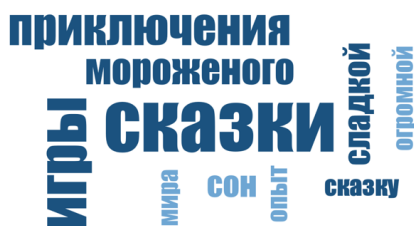
Рис. 1. Результаты контент-анализа по группе социальных репрезентаций «Прошлое» у студентов

Результаты контент-анализа метафор у респондентов, завершивших обучение в вузе, по группе