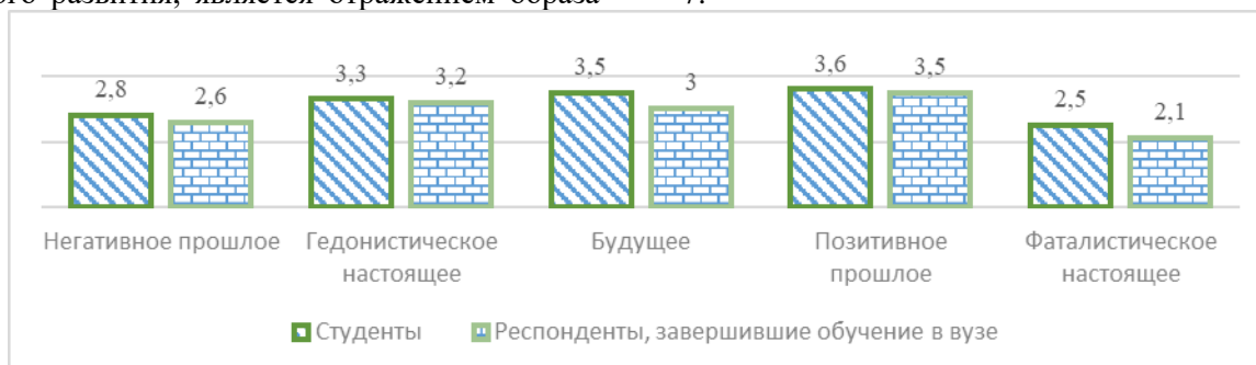
Рис. 7. Средние значения выраженности временной перспективы у студентов и респондентов, завершивших обучение в вузе

будущего, однако в настоящем жизнь студентов в большей степени регламентирована извне, родителями, вузом. В свою очередь респонденты, завершившие обучение в вузе, имеют менее выраженные показатели отмеченным шкалам. Представим в подтверждение средние значения показателей временной перспективы среди респондентов, завершивших обучение в вузе и студентов на рис. 7.