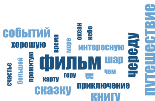
Рис. 5. Данные контент-анализа незаконченных предложений студентов по категории «Будущее»

Результаты контент-анализа метафор по группе незаконченных предложений «Будущее» у студентов изображены на рис. 5.