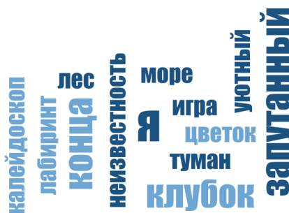
Рис. 3. Результаты контент-анализа по группе социальных репрезентаций «Настоящее» у студентов

Результаты контент-анализа метафор по группе незаконченных предложений «Настоящее» у студентов изображены на рис. 3.